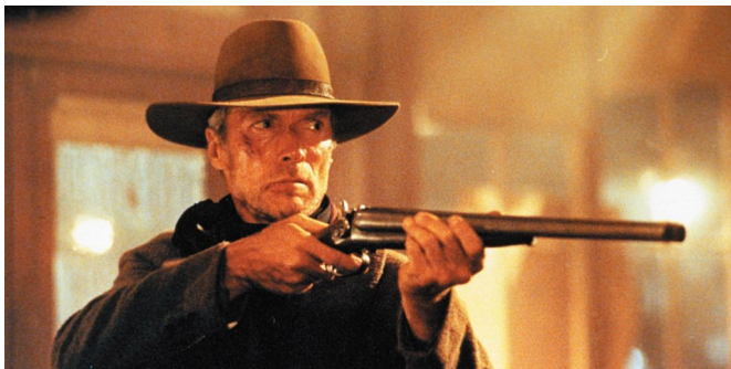
Fotogramas de Hasta que llegó su hora, Dos hombres y un destino y Sin Perdón